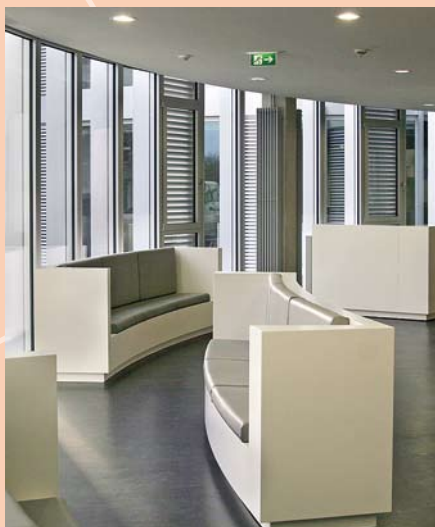
Das ZBZ ist der Standort für Fort- und Weiterbildung, Fachsymposien und andere Veranstaltungen aus dem zahnmedizinisch-biowissenschaftlichen Bereich.

Im ZBZ selbst können Besprechungs- und Vortragsräume flexibel für bis zu 40 Personen angemietet werden. In Kombination mit dem gegenüber liegenden FEZ Forschungs- und Entwicklungs-Zentrum Witten und der benachbarten Universität Witten/Herdecke bietet der zentral gelegene Standort im Herzen der Metropole Ruhr beste Voraussetzungen für die Ausrichtung großer und kleiner Symposien mit zahlreichen Parallelworkshops. Bei Bedarf unterstützt das Team des ZBZ bei der Ausrichtung größerer Veranstaltungen.