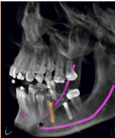
Moderne bildgebende Verfahren wie die digitale Volumentomographie (DVT) stehen im ZBZ zur Verfügung und sollen in ihrem Anwendungsspektrum weiterentwickelt werden.

Neben der anwendungsorientierten Forschung und Entwicklung ermöglicht das ZBZ vor Ort die Qualifizierung von Mitarbeitern und den Transfer von Forschungsergebnissen in die Anwendung . Die gesamte Infrastruktur mit ihren vielfältigen Möglichkeiten kann von Unternehmen des ZBZ und auch von externen Unternehmen mit Bezug zu zahnmedizinisch-biowissenschaftlichen Themen für Fort- und Weiterbildungsmaßnahmen sowie fachspezifische Veranstaltungen genutzt werden.